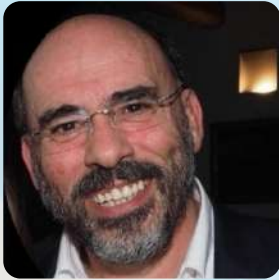
Presidente del Congresso Agostino Inglese

La sterilizzazione dei dispositivi medici riutilizzabili rappresenta uno dei pilastri fondamentali della sicurezza del paziente, un processo complesso e rigoroso che, pur svolgendosi lontano dalla scena clinica, ha un impatto diretto e determinante sugli esiti assistenziali. “Sterilizzazione: un atto invisibile, un impatto vitale” vuole dare voce e visibilità a un ambito spesso sottovalutato, ma essenziale nella catena della qualità e della sicurezza delle cure.